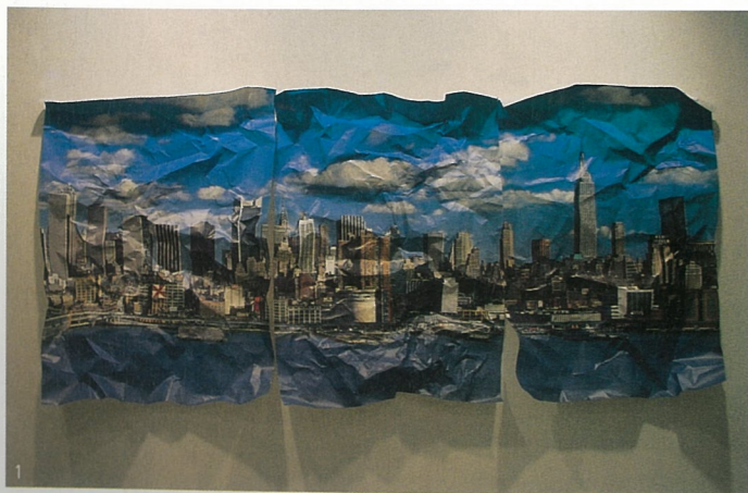
1、局部解剖的风景(日落) 装置 杰斯·大卫拉 2-3、不生产的机器 装置 杰斯·大卫拉 4、局部解剖的风景(纽约) 装置 杰斯·大卫拉